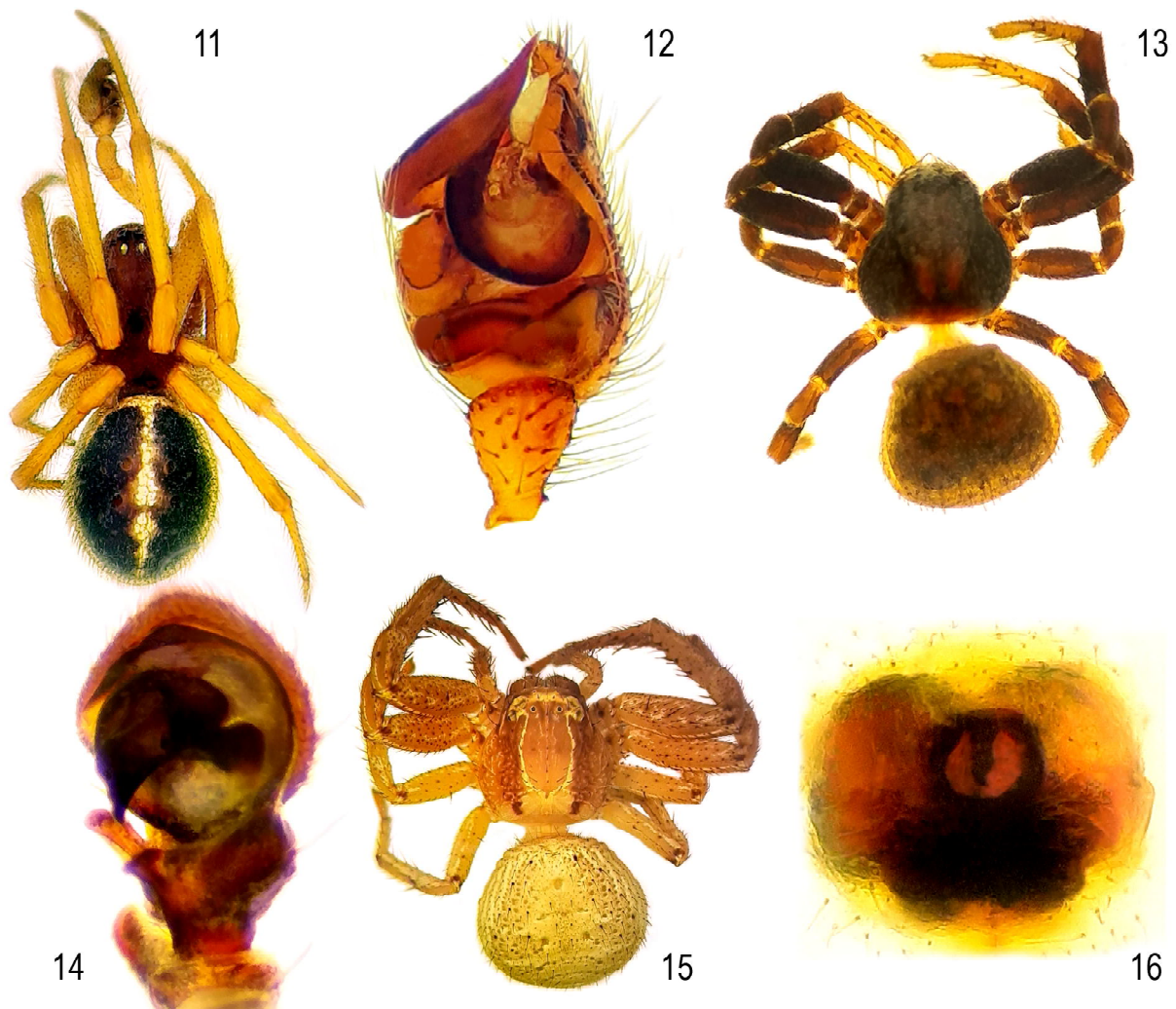
Рис. 11–16. Внешний вид и гениталии пауков: Steatoda bipunctata (11 — внешний вид, 12 — пальпа самца), Ozyptila claveata (13 — внешний вид, 14 — пальпа самца), Xysticus bifasciatus (15 — внешний вид, 16 — эпигина).

Замечание. Данный вид был отмечен в книге «Животный мир Азербайджана» [Gadzhiyev, 1996], однако автор не привёл ссылки на литературные источники, подтверждающие достоверность определения. Скорее всего, на основании этой работы вид был отмечен Михайловым [2013] для фауны Азербайджана. В данной работе впервые приводится достоверная находка этого вида на территории Азербайджана.