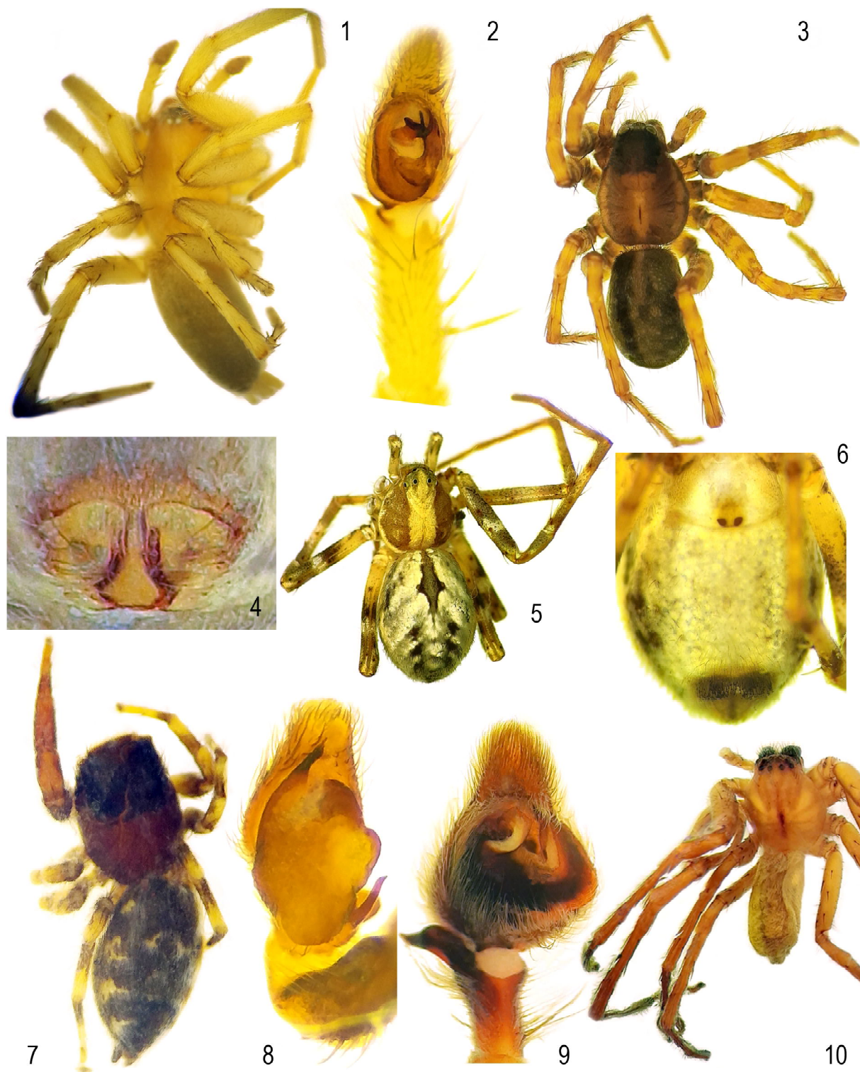
Рис. 1–10. Внешний вид и гениталии пауков: Drassodes caspicus (1 — внешний вид, 2 — палепа самца), Pardosa prativaga (3 — внешний вид, 4 — эпигина), Rhyzodromus richteri (5 — внешний вид, 6 — вентральная часть брюшка с эпигиной), Pseudicius palaestinensis (7 — внешний вид, 8 — палепа самца), Olios sericeus (9 — палепа самца, 10 — внешний вид).

Figs 1–10. General appearance and genitalia of spiders: Drassodes caspicus (1 — general appearance, 2 — male palp), Pardosa prativaga (3 — general appearance, 4 — epigine), Rhyzodromus richteri (5 — general appearance, 6 — ventral part of abdomen with epigine), Pseudicius palaestinensis (7 — general appearance, 8 — male palp), Olios sericeus (9 — male palp, 10 — general appearance).